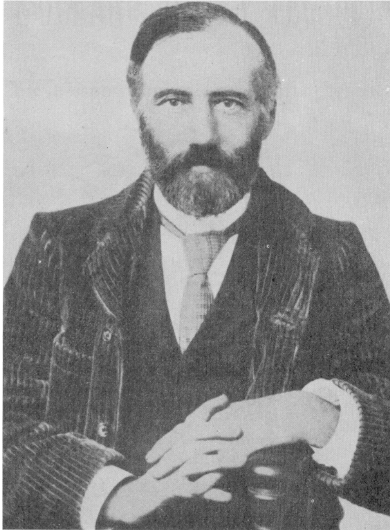
WILLIAM Q. JUDGE 1851•1896

IN COPERTINA: È raffigurato il simbolo della DEA EGIZIA MUT in forma di avvoltoio; l'originale è a Tebe in un affresco della regina Hachepsut (1511-1480 a.C.). MUT è la DEA MADRE; la Divinità Primordiale “da cui tutti gli Dei sono nati”. Simboleggia anche la Sapienza nel suo aspetto dinamico e creativo.